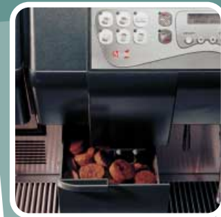
CASSETTO RACCOGLI FONDI CAFFÈ Container for coffee grounds Tiroir recolle fonds de café Kaffeesatz - Schubkasten Deposito contenedor de borra