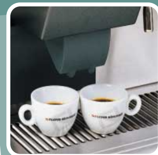
EROGAZIONE CAFFÈ ESPRESSO Espresso coffee delivery Distribution du café-espresso Espresso Abgabe Suministro de café expreso