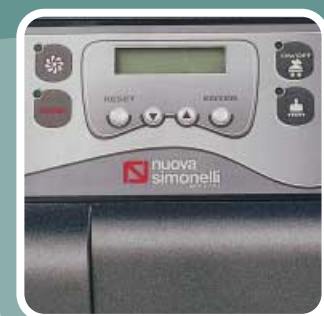
TASTI FUNZIONE Function Keys Funktionstasten Touches de Fonction Teclas de Funciones